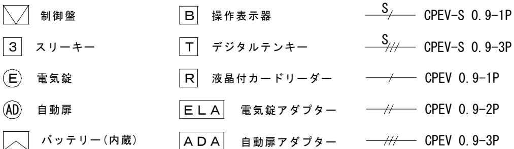
図8-1. 電気錠制御盤の基本系統図